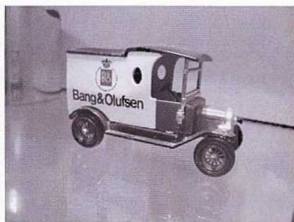
De door Ed Baak uitgebrachte T-Ford.

Een korte pauze werd ingelast waarna de twee groepen wisselden en wij deelnamen aan de Workshop Beo5 gegeven door Louis van Hees.